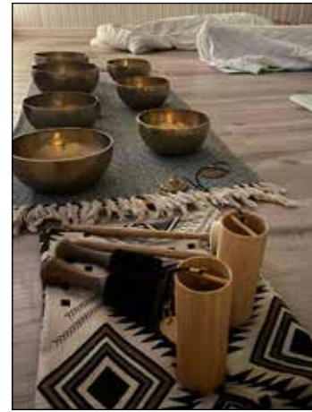
Kursseillamme osataan myös keskittyä rauhoittumiseen ja lepoon.