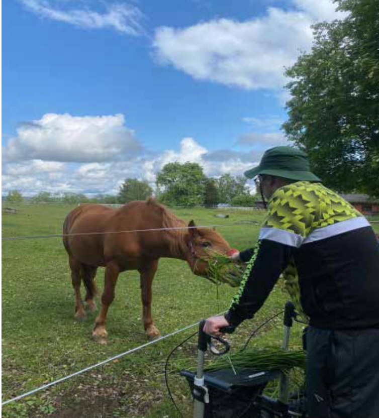
Kurssikeskuksemme Moijalan naapurista voi löytää yllättäviä ystäviä.