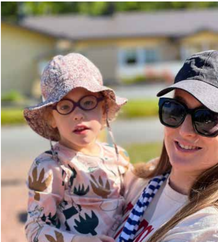
Perhekurssilla lapset leikkivät omia leikkejään osaavien avustajien kanssa sillä välin, kun vanhemmille on omaa ohjelmaa.