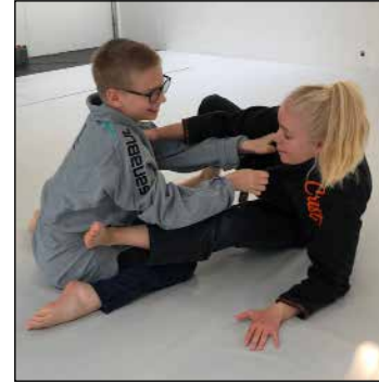
Nuorten jujutsu-kurssilla kamppailtiin hymyssä suin.