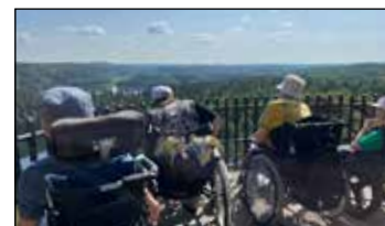
Aulangon näkötorni on yksi suosituista retkikohteistamme.