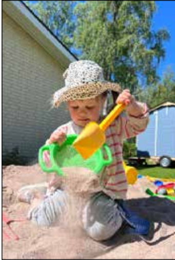
Perhekursseilla jokaiselle osallistujalle tarjotaan ikätasoista ja monipuolista puuhaa.