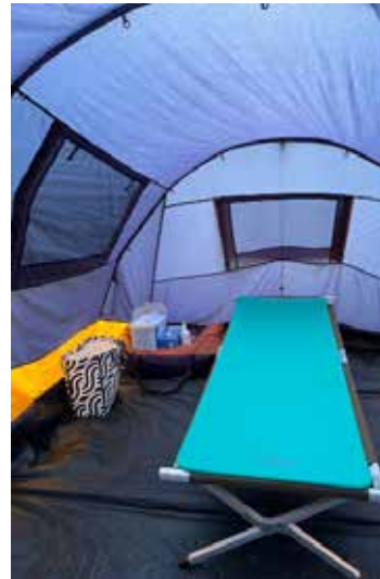
Yö teltassa voi sujua näinkin mukavalla sängyllä.