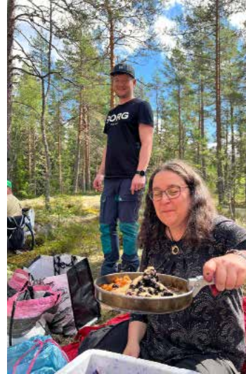
Luonnossa kurssilaisia johdattavat osaavat eräoppaat.