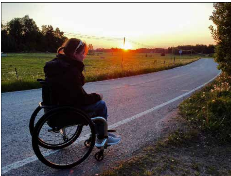
Maalaismaiseman läpi mutkitteleva tie, kesäiset auringonlaskut, pellolla laiduntavat lehmät. Tervetuloa Moijalaan.