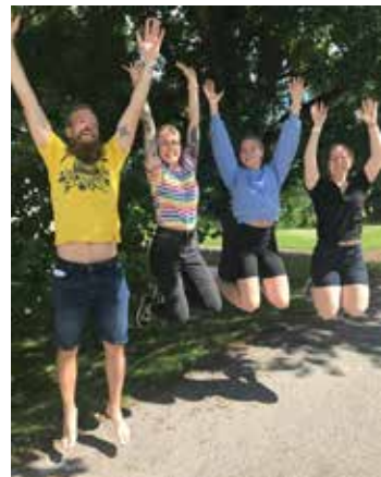
Upeat työntekijämme varmistavat niin isojen kuin pientenkin kurssilaisten viihtyvyyden..