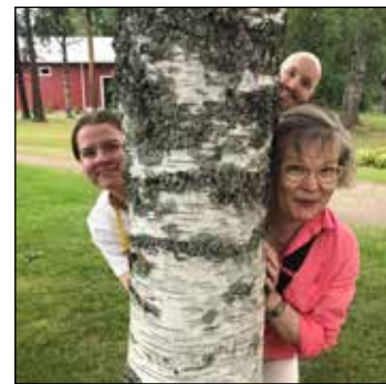
Ystävälliset työntekijämme auttavat pulmassa kuin pulmassa!